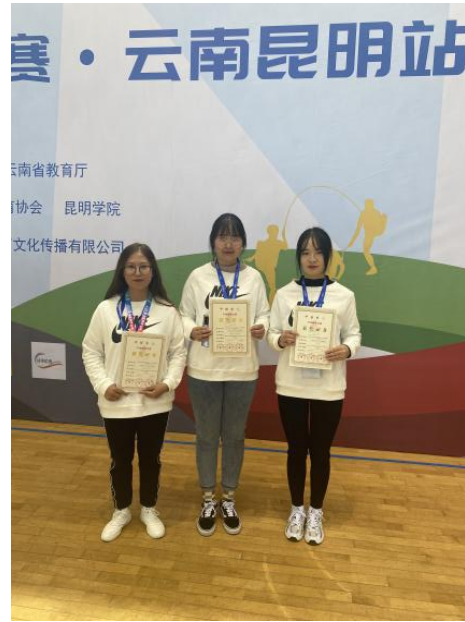
运动员和老师留影