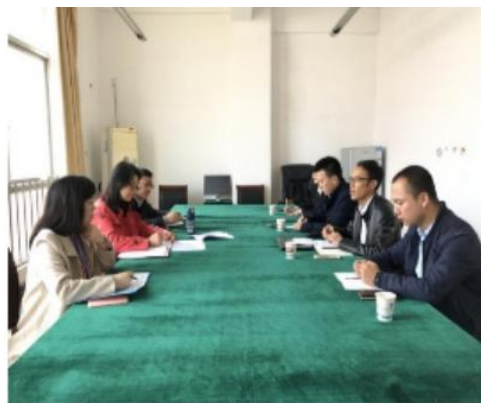
图 4 校企联合制定专业课程体系研讨会

企业实践岗位课程包括职场启蒙、企业真实业务工作—行业账务、业财融合、职业指导等，根据课程体系安排，第二学期安排职场启蒙、第三四学期安排业财融合、python 在财务中的应用、RPA 财务机器人在财务中的应用、第五学期安排真实业务工作的企业账务和就业指导及职业发展规划设计等相关内容。第六学期则是安排学徒到东大正保公司完成定岗岗位实践。实践岗位课程由企业导师承担，校内导师辅助企业导师对学生（学徒）进行辅导和管理，学生（学徒）考核以企业为主。