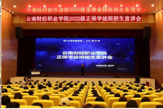
图3 学徒制招生宣讲会